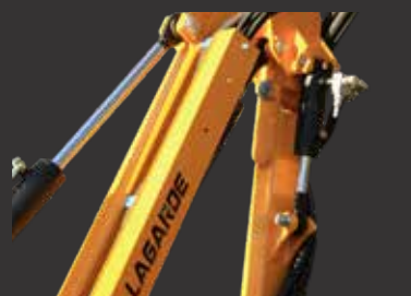
Sécurité hydraulique en option