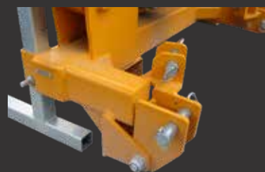
Sécurité mécanique de série