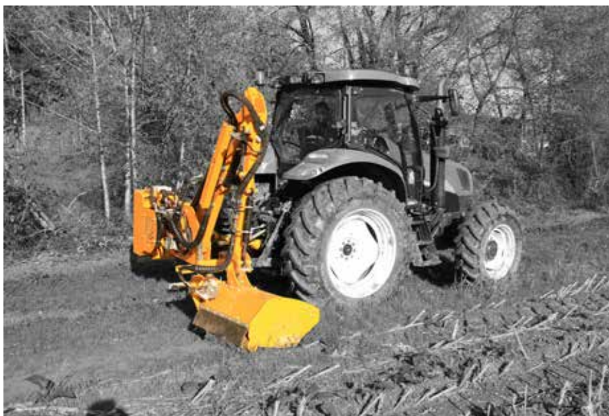
Modèle Callisto 46

Option sécurité hydraulique et entraînement du rotor par courroies.