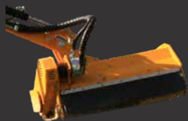
Entraînement indirect en option