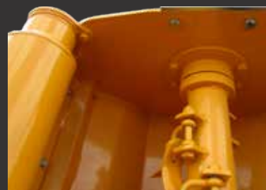
Palier intérieur avec chicanes