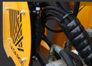
Refroidisseur de série